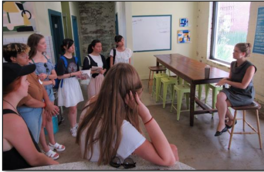
[起業のアドバイスをする女性弁護士]