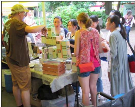
[ファーマーズマーケットにて]

6 日目の土曜日は、GA (Global Ambassador) たちに案内されて、ファーマーズマーケットを訪れました。この研修で“Global Ambassador”を務める 8 人は、この研修のために事前にインタビューを受けて選ばれた生徒たちです。彼女たちと多くの経験を共有し、お互いに刺激を受けて、国境をこえた絆が芽生えています。