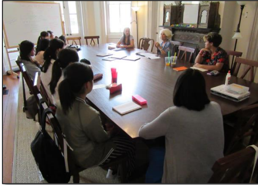
[習熟度別クラスでの授業の様子]