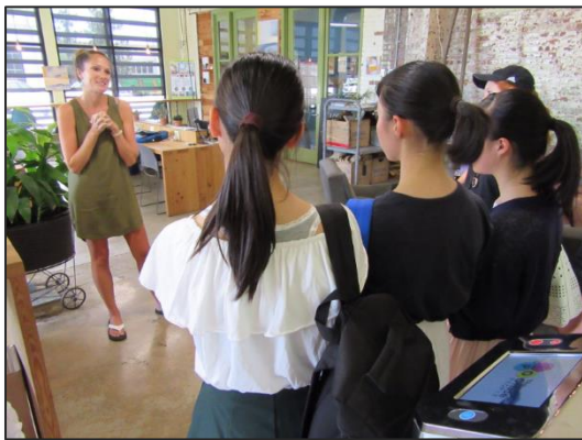
[センターを利用して起業した女性]