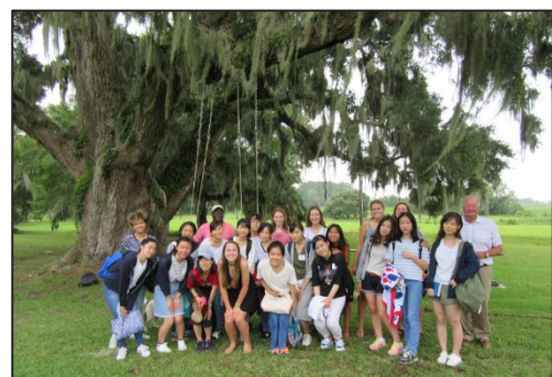
[巨大なスパニッシュモスの木の下で]